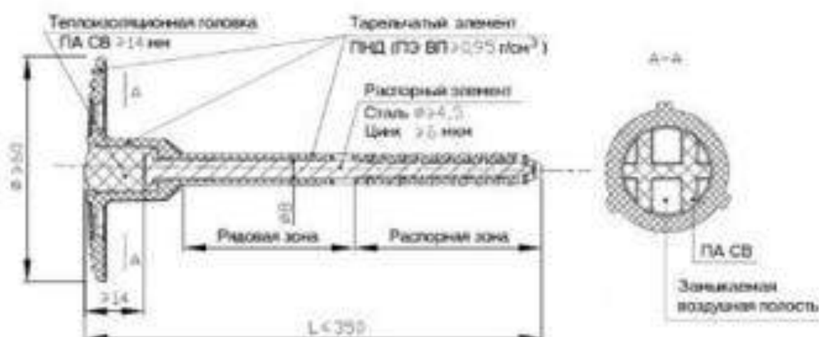
Рисунок 1 — Пример анкера с тарельчатым добелем

6.8.3 Допускается применение стального распорного элемента без опрессовки при наличии конструктивно предусмотренной герметизирующей заглушки с воздушной прослойкой высотой не менее 14 мм.