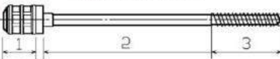
б) Завинчиваемый стальной элемент

1 — теплоизоляционная головка; 2 — рядовая зона; 3 — резьбовая зона